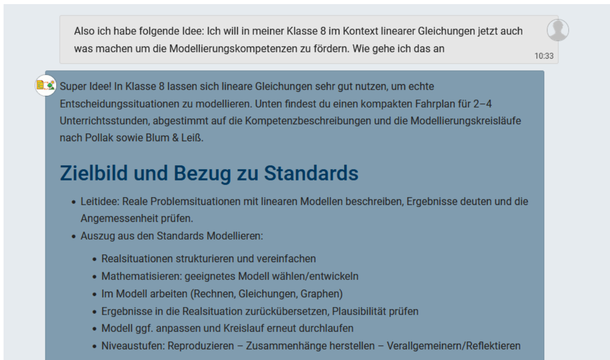
Abbildung 1: Dialog und Grafik erstellt mit Sidekick (Tobit) & GPT 5